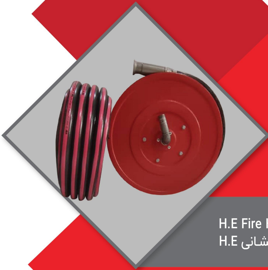
H.E Fire Hose Reel قرقره هوزریل آتش نشانی H.E