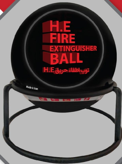
H.E Fire Extinguisher Ball توپ اطفاء حریق H.E